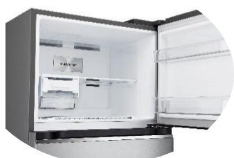
Bac à glaçon Touch Twist