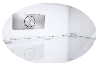
Finition intérieure métallique