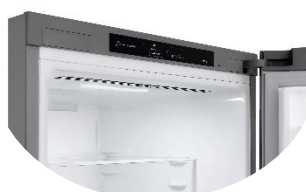
Display intérieur discret