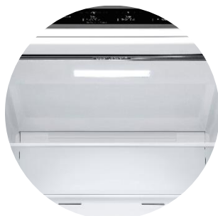
Door Cooling™ & Soft LED